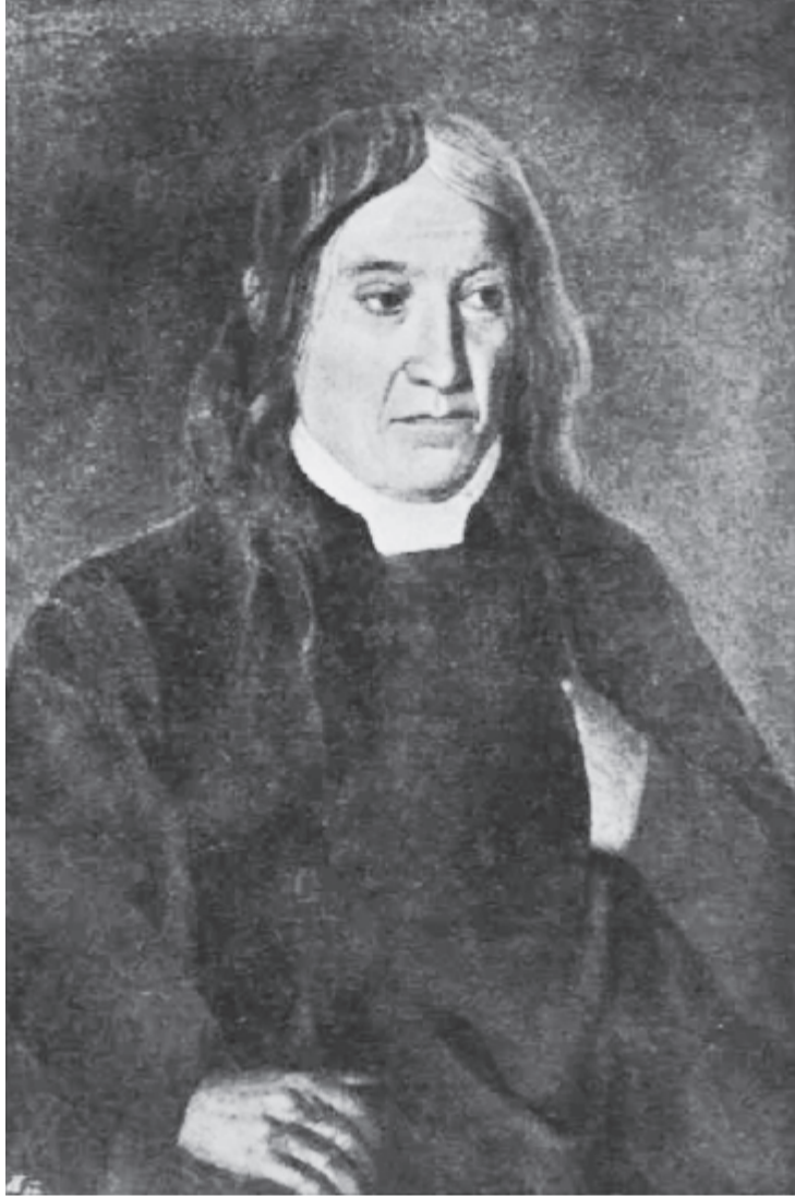
Bolyai Farkas

Bolyai Farkas esetében ez a hármas tehetség egyidejűleg volt jelen, bizonyítva, hogy ezek valóban összefüggő képességek. 1781-től a nagyenyedi kollégiumban tanult, ahol kitűnt különleges nyelvtelenséggel. Rövid