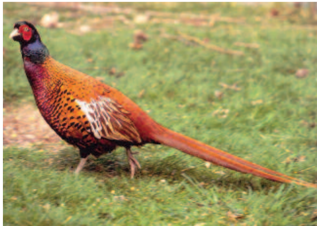
Fácán (Phasianus colchicus)

Közismert vadmadarunk. Hajdani hazája a Kaukázustól az Amurig és Burmáig terjedt. Az utóbbi századokban eredeti hazájától messzire is elterjedt, főként betelepítés révén. Közép-Európában már a középkorban meghonosodott. Szent Heléna szigetén már 480 éve kedvelt madár. Japánban is mindenfelé él. Betelepítették Észak-Amerikába, a Hawaii-szigetekre és Új-Zélandra is. A fenti állományok leginkább 30 vadon élő alfaj keverékéből állnak. A hazai állomány többségénél fehér nyakörvet látni, amely elválasztja a fej zöldes fényű színezetét a hát rézvérvörös és aranybarna, fekete pikke-