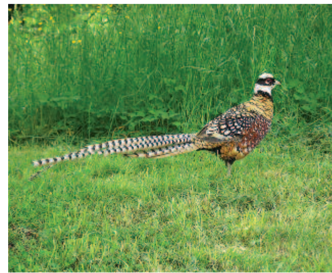
Királyfácán (Syrmaticus reevesi)

Színpompás tollazatával a legszebb fácánok közé tartozik. Észak-Kínában jól ismerik. Négy rokonának a színe is hasonlóan szép. Ennek a ritkás erdőben élő fajnak a színe aranysárga, amelyet sűrű, fekete pikkelyes rajzolat díszít; a farka szép harántcsíkos, és ezzel együtt eléri a két métert. Szerte a világban minden állatkertben látható. A pompás rézfácán (Syrmaticus soemmeringii) jóval ritkább, Japán erdős részein él. Rézvörös színezetében világos és sötét árnyalatok váltakoznak.