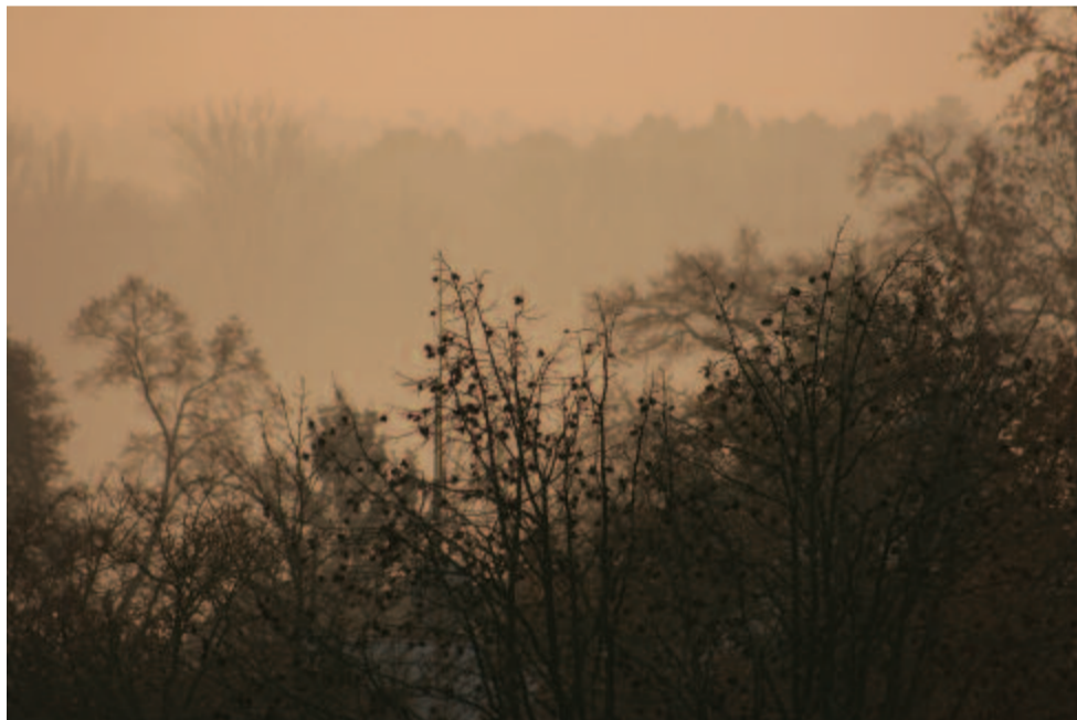
Köd felleg szakadoz felénk

E sorokat épp egy év híján két századévvvel ezelőtt írta volt tizennyolc évnyi élete tapasztalásaiért az Ódák ötödik darabjában, A pusztai vadász ban a 216 éve, 1800. december elsején született Vörösmarty Mihály . December elsején emlékeztünk meg arról is, hogy 70 éve, 1946-ban megjelent – mindössze 5000 példányban – a mindmáig legnépszerűbb tudomány népszerűsítő folyóirat, az Élet és Tudomány első száma Szent-Györgyi Albert beköszöntőjével. Néhány cím az első számból: 1 gramm plutónium = 15 tonna benzín; Eötvös Loránd, a tudós és az ember; Milyen öreg a Föld? Földünk síkban való ábrázolása ma is jószerint a Mercator-féle szögtartó hengervetülettel történik. E vetületnél a pólusok irányában nő a térkép torzulása, viszont a délkörök s a szélességi körök merőlegesek egymásra. Megalkotója, Gerardus Rupelmonde Mercator geo- és kozmográfus, térképész, 422 éve, 1594. december 2-án született Flandriában.