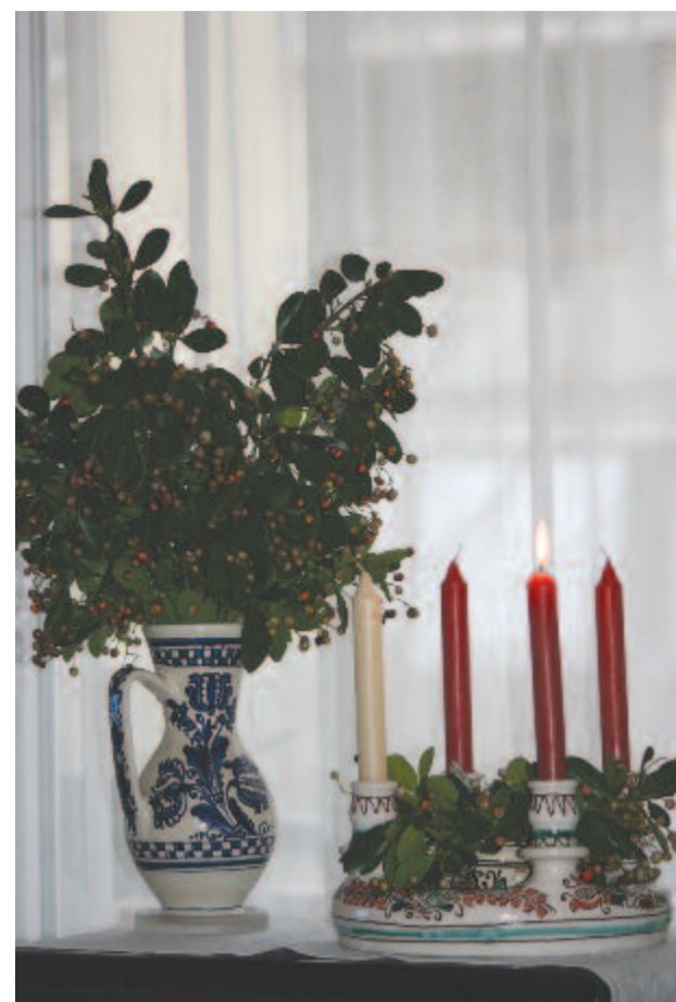
Az első adventi gyertya égve várja a második lángra kapását

Omar Khayyam perzsa matematikus vallo-mása e négy sor a megszerzett tudás paradoxonjáról. 83 éves korában, 1131. december 4-én hagyott fel végleg a mindenség titká-